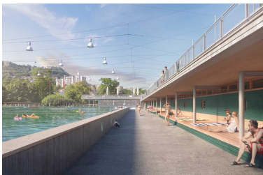
Kunstseilbahn und Wellenbad im Dählhölzli in Bern – in Planung