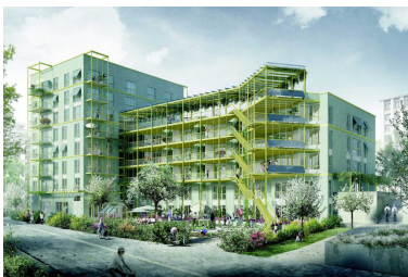
genossenschaftlicher Wohnungsbau im Holliger in Bern – in Ausführung