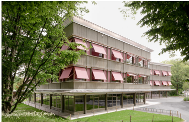
Erweiterung Schulhaus Marzili in Bern – abgeschlossen 2019